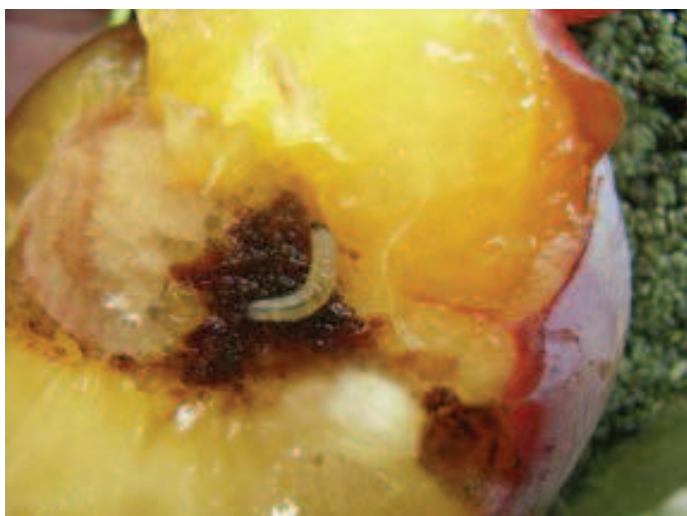
Rups van de pruimenmot.